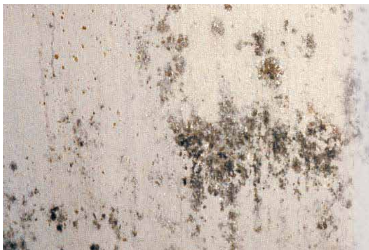
Navaden premaz proti plesni po 3 letih

Povsod kjer je potrebna zaščita proti plesnim in kvasovkam iz higijenskih ali optičnih razlogov je premaz EUROPAL popolna rešitev. EUROPAL stenski premazi so se kot stenska zaščita proti plesni izkazali v industriji hrane in pijače kot so pivovarne, vinske kleti, mlekarnе, pekarnе, tovarne sladu, pekarnе peciva in slaščic, mesna in konzervna industrija, kuhinje, gostinski obrati, catering, klavnice, hladilnice in druge.